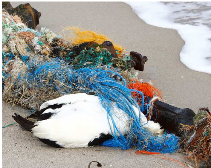
Ein toter Eiderenten-Erpel im Netzrest.

Jever - Wie die Spielzeugschaufeln am Strand liegenbleiben, kann man sich ja noch vorstellen. Aber die Zahnpastatuben, Shampooflaschen und Klobürsten? Die Netze, in denen Vögel verenden, den Magen voller kleiner Plastikteile? Bei alledem ist die Kiste voller Flaschenpost noch eine nette Randnotiz der Ausstellung, die der Mellumrat vom 12. bis zum 25. April im Schloss in Jever zeigt. Der Eintritt ist frei - die Küsten sind es nicht: Mehr als 700 Plastikteile liegen pro 100 Meter an jedem europäischen Strand. In unserer Region registriert der Mellumrat seit den neunziger Jahren als einzige Organisation systematisch die Verschmutzung der Strände mit Müll aus dem Meer, zum Beispiel auf