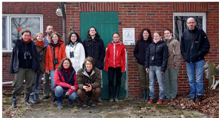
Die Naturschutzwarte des Mellumrates der Betreuungssaison 2010 vor der Station auf der Strohauser Plate.

Die NaturschutzwartInnen arbeiten ehrenamtlich und werden in jedem Schutzgebiet von ebenfalls ehrenamtlichen Fachleuten angeleitet und betreut. Im Wesentlichen dient ihr Einsatz dem Schutz der Natur. Darüber hinaus werden Forschungsvorhaben nationaler und internationaler Institute und Universitäten unterstützt. Die dokumentarische und wissenschaftliche Arbeit in den Schutzzonen liefert Grundlagen für das Engagement Deutschlands im internationalen Wattenmeerschutzes und nationalen Natur- und Artenschutzprojekten. Außerdem spielt die Schutzgebietsbetreuung gerade im WeltNaturerbe "Wattenmeer" eine immer wichtigere Rolle im Fremdenverkehr. So ist die Öffentlichkeitsarbeit ebenfalls ein Bestandteil der Arbeit. Gut vorbereitet, hoch motiviert und voller Erwartungen reisen die jungen Leute in der kommenden Woche für bis zu 8 Monaten auf „ihre“ Insel.