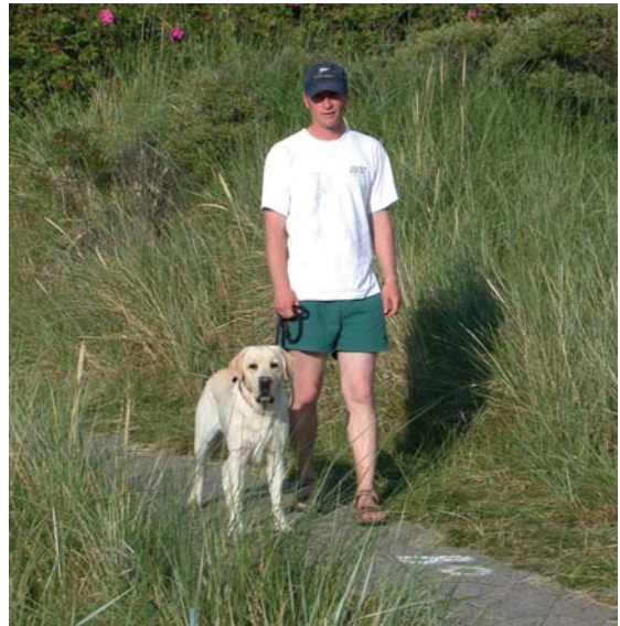
So ist es richtig: Mit dem Hund an der Leine und auf dem zugelassenen Weg die Natur erleben, ohne zu stören.

"Wildlebende Vögel betrachten Hunde instinktiv als Feinde", erklärt Arndt Meyer-Vosgerau, Dezernatsleiter für Naturschutz bei der Nationalparkverwaltung. "Wiederholte Fluchtreaktionen können den Erfolg des Brutgeschäftes und damit den Erhalt seltener Vogelarten erheblich beeinträchtigen." Dabei merken die meisten Spaziergänger nicht, welchem Stress Vogeleltern ausgesetzt sind. Gerade kleine bodenbrütende Vögel sind durch ihr Gefieder gut getarnt, entfernen sich bei Gefahr heimlich vom Nest, ducken sich weg - so lange sind Eier oder Küken ungeschützt vor Kälte bzw. Hitze und Fressfeinden und der Nachwuchs kann nicht gefüttert werden.